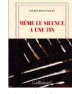
Même le silence à une fin Ingrid Betancourt